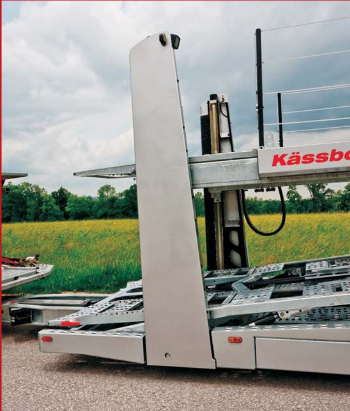
Intago ts Säulengruppe vorne mit Spindelhubgetriebe für optimale Hubleistung