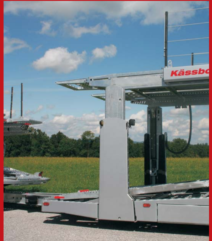
Intago tt Die Hubvorrichtung vorne ist so optimiert, dass auf der oberen Ebene größtmögliche Ladebreite zur Verfügung steht.